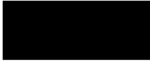
M e Marc Lapointe Le Corre et associés